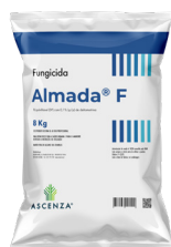
Sacco: 8 kg Pallet: 640 kg